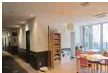
食堂・デイルーム

食堂・デイルームはセルフサービスのお茶や自動販売機があります。患者様、ご家族の方もお気軽に談話ルームとしてご使用下さい。