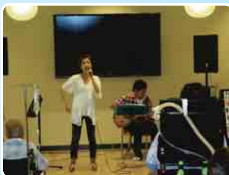
歌手の神山さやかさんによる歌のプレゼント