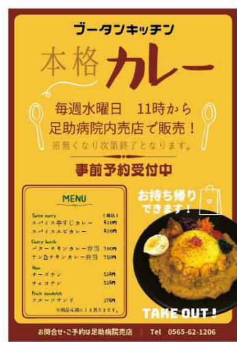
▲カレー弁当のチラシ

既に開催しているのが、毎週水曜日に販売する本格カレー弁当です。通常販売ではすぐに売り切れてしまうほどの人気商品です。カレーのほかにも様々なナンやフルーツサンド等も販売しています。確実に入手されたい方は予約されることをお勧めします！