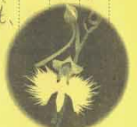
生徒より頂いた感謝メッセージ

放射線技師について教えてくださりありがとうございました。今までは「放射線」と聞くと原爆や原発のイメージがありました。放射線については理科で少し習いましたが、それ以外はほとんど知りませんでした。今回お話を聞いて、X線検査やがん治療など、どのように使われているのかや、医療で使われている放射線の痛みがない、短時間でできるなどの良さが分かりました。また自然放射線、人工放射線も、難しい話だと思いましたが、分かりやすく、私でも理解できました。私たちには、いろいろなところから放射線が使われていると知り少し驚きました。放射線の様々な使われ方を知ることができ、今更々持っていたイメージから、たくさんの方の病気を助けたりと知っているものに、イメージが変わりました。医療についても知りたくなりました。ありがとうございました。