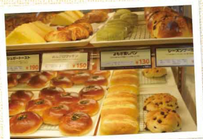
おなじみ焼き立てパンも販売中です