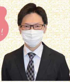
当院売店の エリアマネージャーさん 様々な企画の仕掛け人です▶