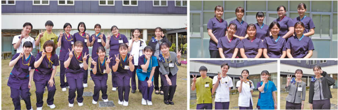
▲ 新入職員オリエンテーションを行いました

令和6年4月より新入職員が入職しました。さまざまな研修を経て、現在所属部署で先輩に教わりながら業務に励んでおります。他の職員共々よろしくお願いたします。