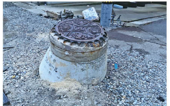
▲ 地震によって隆起した下水管とマンホール

令和6年5月6日～8日にかけて、足助病院職員にて編成されたJMATが能登半島地震で被災した石川県輪島市の医療支援活動を行いました。金沢市内よりレンタカーで移動しましたが、途中の「のと里山街道」では穴水町付近より被害が顕著となっており、発災4カ月経過後もまだまだ復興には至っていませんでした。輪島市内に入ると、大規模な土砂崩れと倒壊した家屋が数多く手つかずの状態でした。