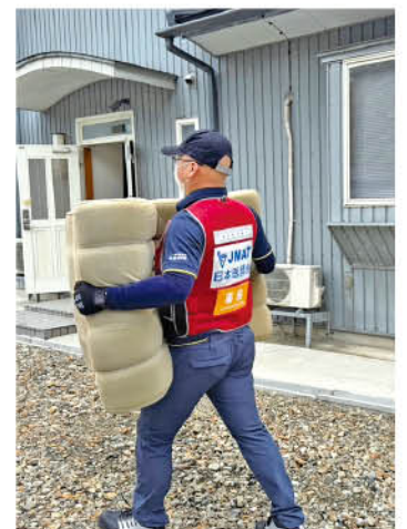
▲ クリニックにて、災害ごみを搬出

回診終了後は、地域の開業医の先生のサポートに向かいました。被災しているにもかかわらず、地域住民のためにもう一度立ち上がろうとする先生に心を打たれ、クリニックの後片付けをお手伝いさせていただきました。JMATの任務にはこのような支援も含まれるのです。