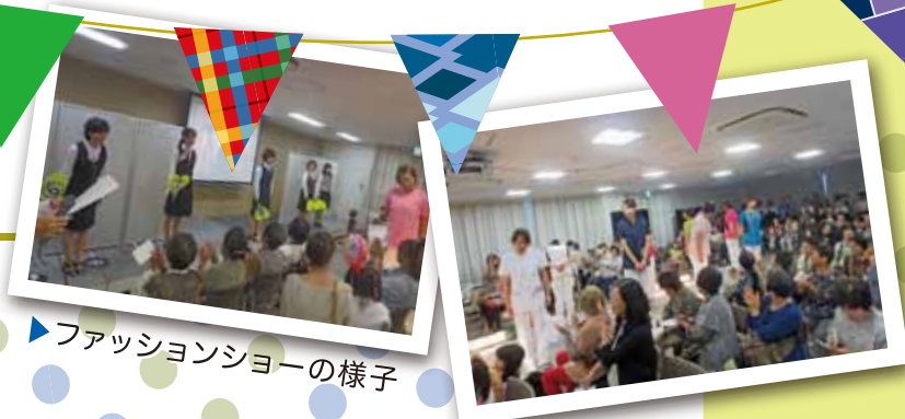
▶ファッションショーの様子