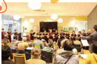
10月25日(火) コールメイフル、The Oakland