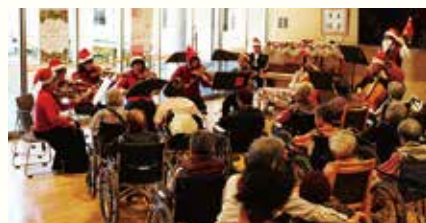
12月19日(月) 愛知県医師会交響楽団