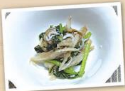
小松菜と舞茸の粉チーズ和え