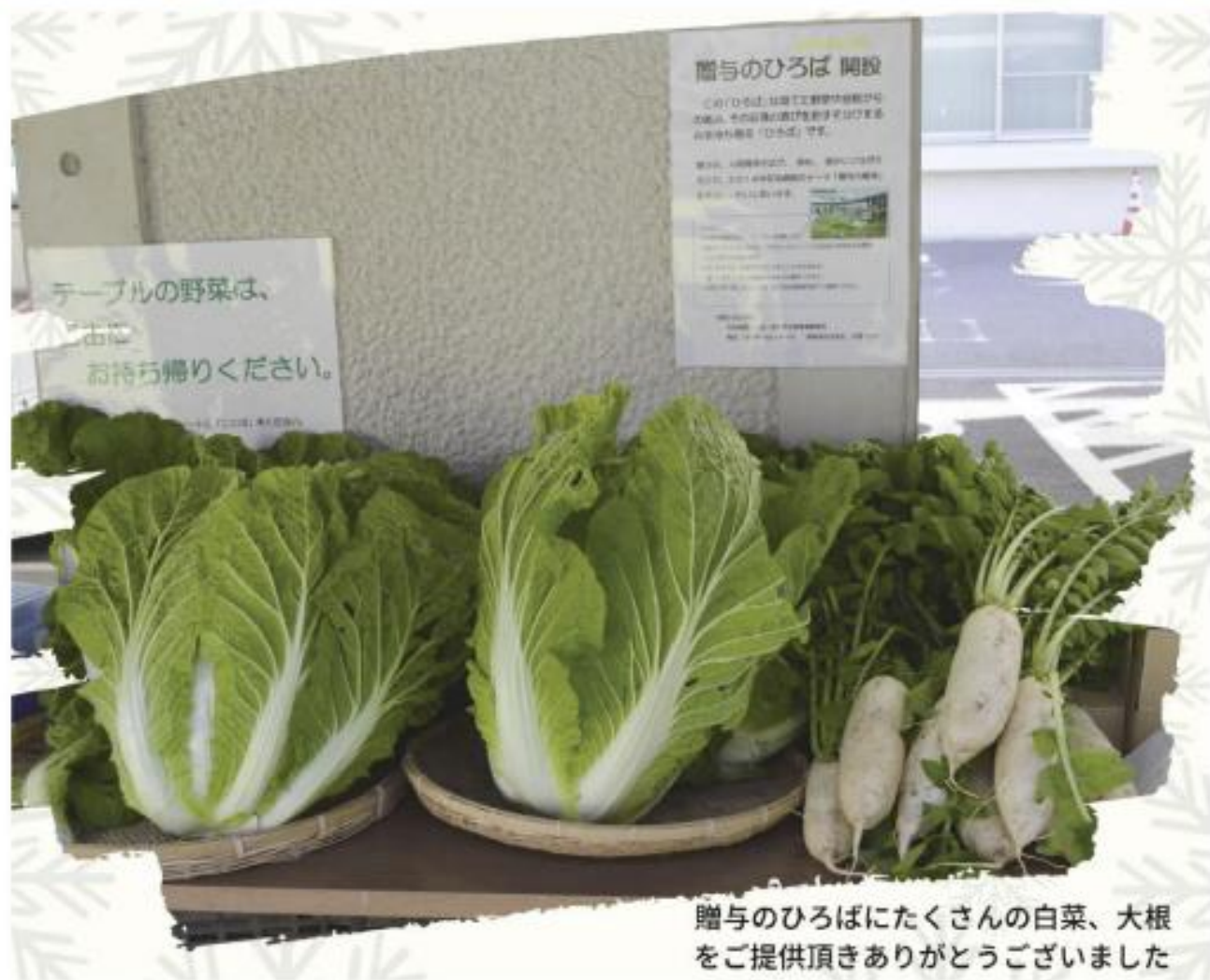
贈与のひろばにたくさんの白菜、大根 をご提供頂きありがとうございました