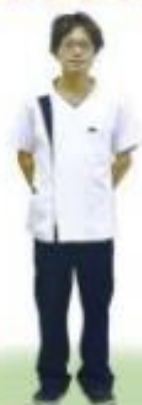
薬剤師・放射線技師 臨床検査技師・臨床工学技士 視能訓練士・理学療法士・作業療法士