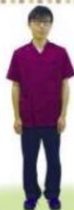
ケアマネージャー