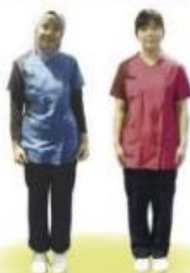
介護福祉士・看護助手