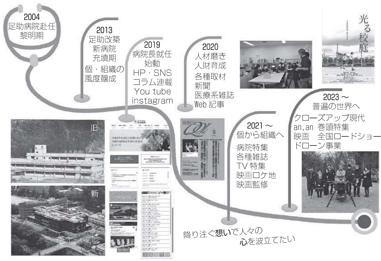
図表2 足助病院ブランディングプロジェクトの軌跡