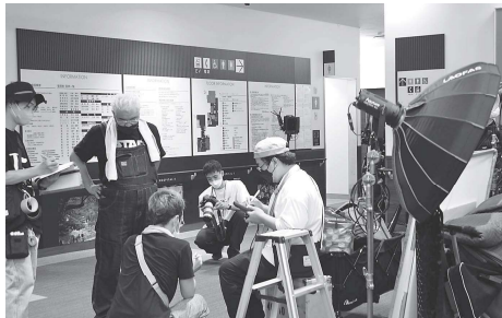
映画撮影風景：院内・院外