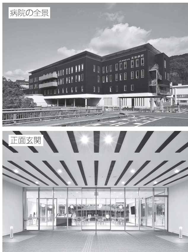
図表1 足助病院の概要