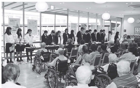
院内コンサート 足助高校生と共に