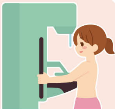
マンモグラフィ検査