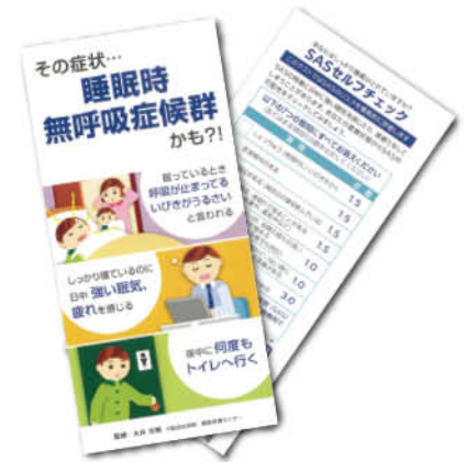
〈当院で配布しているパンフレット〉