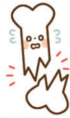
転んで骨折してしまった