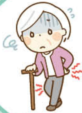
背中が曲がってきた