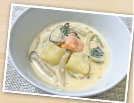
鮭とかぶのシチュー

骨は主にコラーゲンというたんぱく質と、カルシウムやリンなどのミネラルから構成されています。コラーゲンは骨の基盤を作る重要な成分であり、骨の強度に関係しています。たんぱく質の摂取が不足すると、骨に必要なコラーゲンの合成が減少し、骨の強度が低下するおそれがあります。これにより、骨粗鬆症のリスクが高まると考えられています。