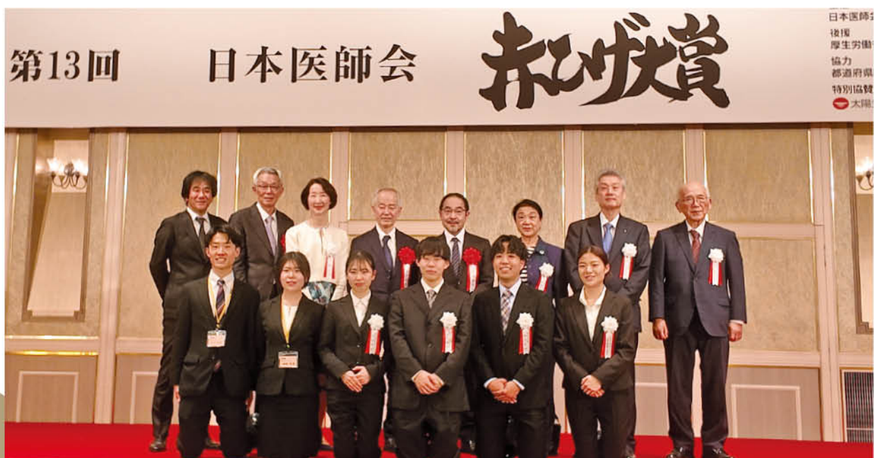
▲ 2/21 明治記念館における表彰式にて