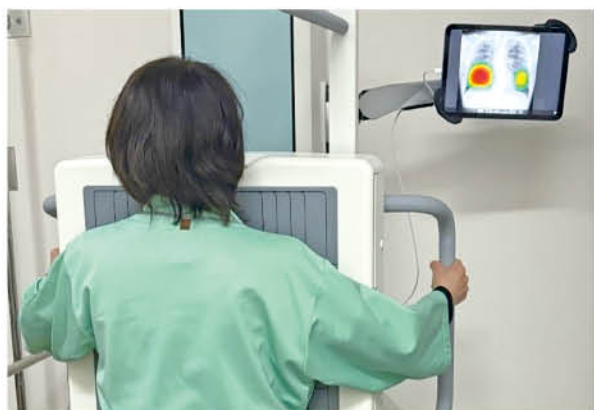
▲ 胸部X線一般撮影の様子

2024年12月23日、足助病院は AI を搭載した放射線一般撮影の読影システム (CXR-AID : 富士フィルム社) を導入しました。このシステムは、撮影した胸部単純 X 線画像を AI にて自動解析し、結節・腫瘤影、浸潤影、気胸が疑われる領域を検出しマーキングします。その領域を医師が再確認することで、見落とし防止を支援するものです。日常診療だけでなく健康診断の胸部単純 X 線検査で活用してまいります。